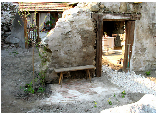
2. Während der Ausführung – 6.5.2006