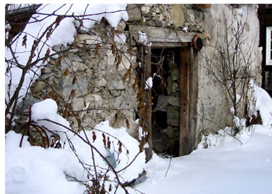
8. 3 Jahre (Winter) nach Fertigstellung – 18.2.2009