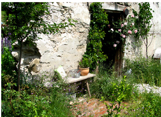
4. 1 Jahr (Sommer) nach Fertigstellung – 8.6.2007