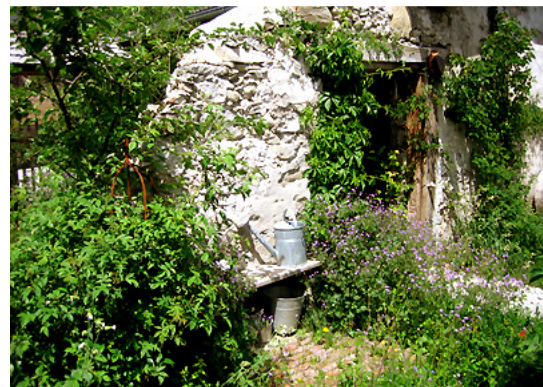
6. 2 Jahre (Frühl.) nach Fertigstellung – 30.5.2008