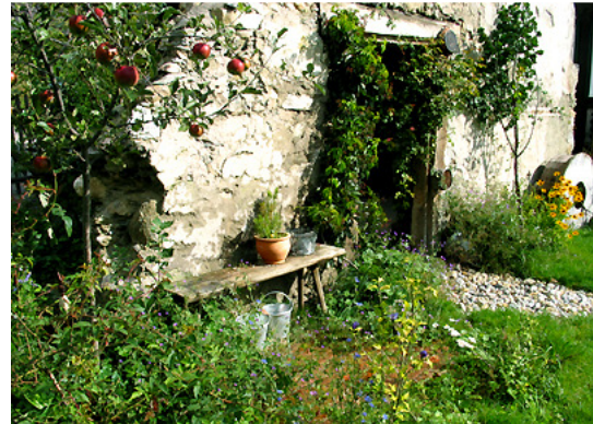
5. 1 Jahr (Herbst) nach Fertigstellung – 9.9.2007