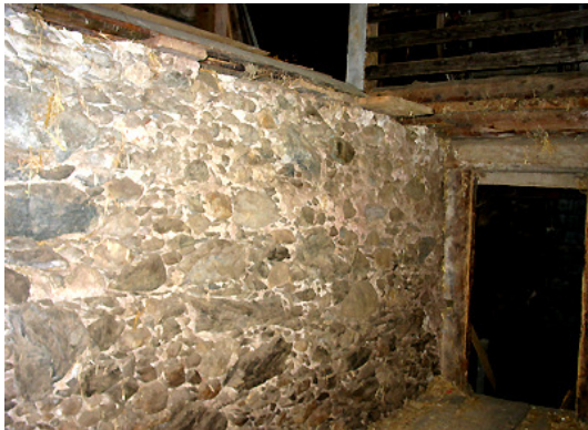
1. Vor der Ausführung – 20.5.2005